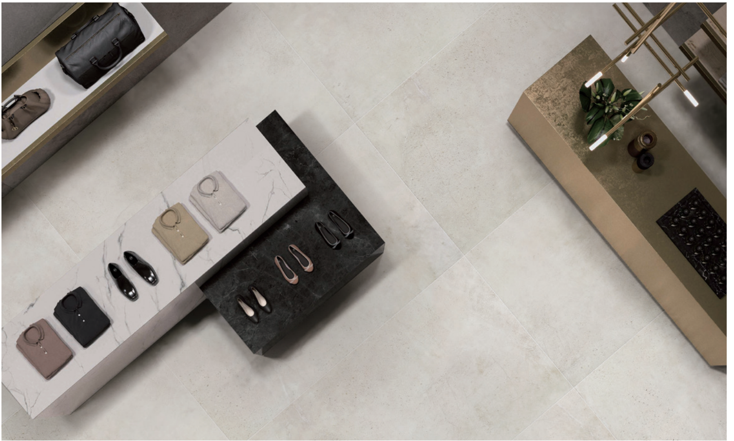
GRIS PÂLE mat