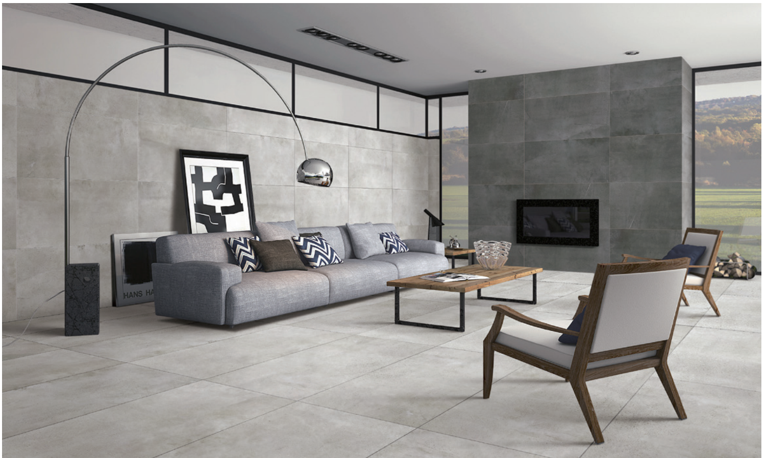
GRIS MOYEN mat